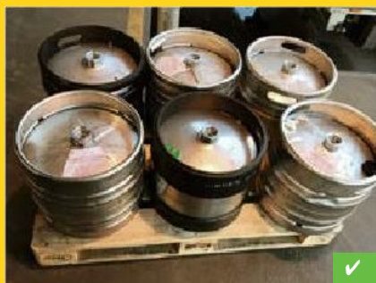
Fustager: kun 1 lag